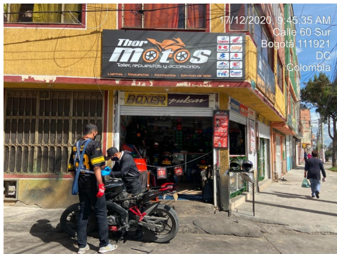
Fotografía aviso en fachada por CR