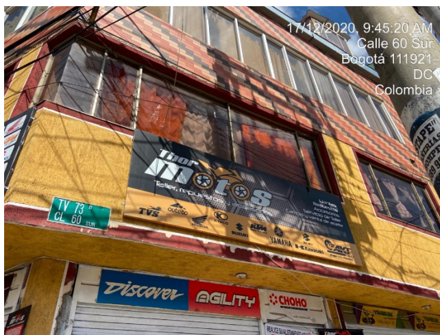
Fotografía aviso en fachada